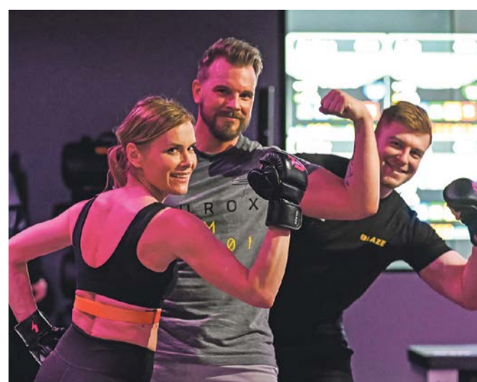
Schwitzt regelmäßig beim Blaze im neuen Hightech-Loft des Lloyd Meridian Spa & Fitness: Schauspielerin Andrea Lüdke.

Blaze ist ein Mix aus Fitness, Motivation und technischem Support – dabei ist das Programm aufgrund der individuellen Trainingsintensität für Einsteiger und Fitness-Profis gleichermaßen geeignet. Im Trend liegt, dass die persönliche Belastung der Trainierenden sorgfältig geprüft wird, um persönliche Ziele und Grenzen bewusst anzusteuern. Weitere Informationen zum renovierten Club im Alstertal gibt es unter: www.meridianspa.de/de-de/clubs/hamburg-alstertal . (sc)