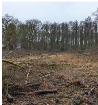
Baumfällungen und Gehölzschnitt auf der Feuchtwiese im Wohldorfer Wald.