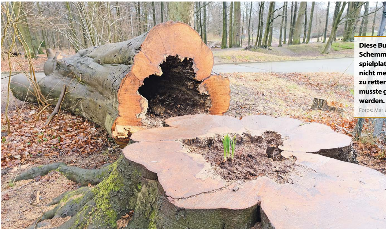
Diese Buche am Schemmannspielplatz war nicht mehr zu retten und musste gefällt werden.