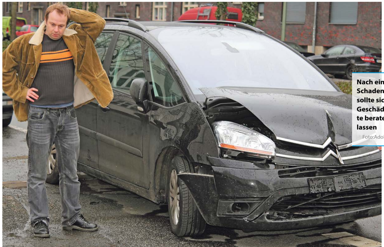
Nach einem Schadensfall sollte sich der Geschädigte beraten lassen

Das sah der BGH im Revisionsverfahren anders. Der Kaufvertrag komme erst mit der notariellen Beurkundung zustande. Bis dahin könne eine Käuferin oder ein Käufer die eigene Entscheidung überdenken und sich dabei auch von einem Exposé beeinflussen lassen. Trotz der ausgeschlossenen Haftung für Sachmängel komme ein Schadensersatzanspruch in Betracht, wenn die Verkäuferin wusste, dass das Exposé falsche Angaben enthielt und sie damit arglistig handelte. Da dies noch nicht abschließend geklärt war, verwies der BGH den Fall an das Oberlandesgericht Hamburg zurück. (red)