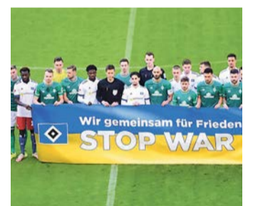
Solidaritätsaktion im Volksparkstadion.

So erreichen Sie mich: Sport@heimatecho.de