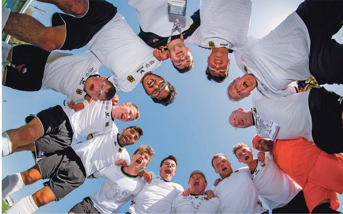
Ob Fußball, Leichtathletik oder Turnen: In diesem Jahr veranstaltet das Projekt „Regionalliga Inklusion“ vom 7.-11. März 2022 wieder eine Inklusionswoche.

POPPENBÜTTEL Auf die Oberliga-Herren der SG Hamburg-Nord wartet in den kommenden Tagen ein strammes Programm. Insgesamt bestreitet das Team von Matthias Steinkamp und Stephan Stop vier Begegnungen in neun Tagen. Zwei davon in eigener Halle: Am 2. März 2022, 20:30 Uhr, empfängt das Team den FC St. Pauli und zwei Tage später, am 4. März 2022, 20:30 Uhr, kommt der TSV Ellerbek an den Tegelsberg. Einlass ist jeweils ab 19.45 Uhr. Es gelten die 2G+ Hygienebestimmungen. Es besteht Maskenpflicht. (sc)