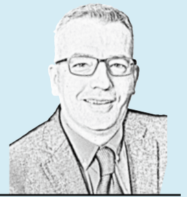
Die Sportkolumne von Sebastian Conrad