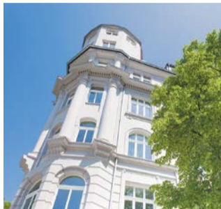
Hält das Exposé was es verspricht?

Die Käuferin eines sanierungsbedürftigen Objekts verklagte die Verkäuferin auf Schadensersatz. Dabei berief sie sich darauf, dass das ihr übergebene Exposé falsche Angaben zur Sanierbarkeit der Immobilie enthielt. Zunächst wies das Oberlandesgericht Hamburg die Klage mit der Begründung ab, die Käuferin habe das Exposé erst erhalten, nachdem sie bereits ihre Bereitschaft zum Kauf des Objekts erklärt hatte. Die falschen Angaben hätten daher ihren Kaufentschluss nicht beeinflusst. Außerdem sei im notariellen Kaufvertrag die Haftung für Sachmängel ausgeschlossen worden.