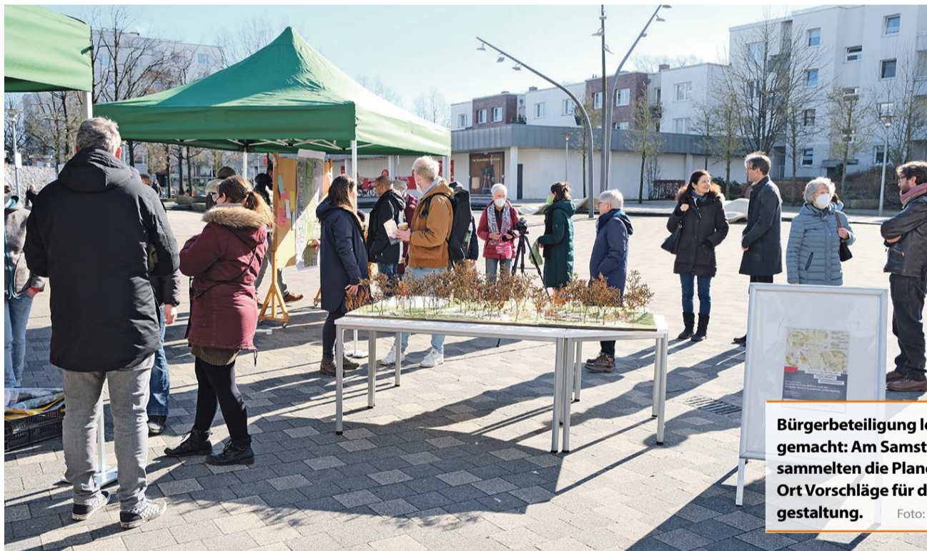
Bürgerbeteiligung leicht gemacht: Am Samstag sammelten die Planer vor Ort Vorschläge für die Neugestaltung.

Der Umbau des Parks ist Bestandteil des Rahmenprogramms für integrierte Stadtentwicklung (RISE), das bis Ende 2027 die nachhaltige Entwicklung und städtebauliche Aufwertung des Gebiets Tegelsberg/Müssenredder vorsieht. Für Informationen über die konkreten Maßnahmen und als Anlaufstelle für Anregungen und Beteiligung an der Umsetzung hat die federführende Lawaetz-Stiftung ein eigenes Büro – Internet-Adresse www.stetteilbuero-temu.de – in einem Ladengeschäft am Norbert-Schmid-Platz eingerichtet.