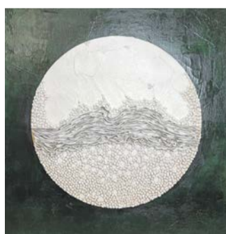
Steinige Wege von Manuela Mordhorst.

VOLKSDORF Die Ev.-Luth. Kirchengemeinde Volksdorf lädt vom 19. März bis zum 15. Mai zu einer Ausstellung „Aufbruch“ mit Werken von Manuela Mordhorst in der Kirche am Rockenhof ein. Manuela Mordhorst setzt sich seit Jahren mit inneren und äußeren Strukturen und Landschaften auseinander. Immer wieder begreift sie die Formen und Wandlungen in der Natur als Sinnbilder menschlicher Prozesse des Werdens. Alles Lebende ist von Aufbruch befallen. Zwischen Winter und Frühling und an der Schwelle zwischen Passions- und Osterzeit entfaltet sich